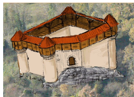
Les dimensions impressionnantes du donjon principal laissent penser qu'il s'agissait là de la résidence d'un grand seigneur.. La rareté des ouvertures indique que les murs avaient un rôle défensif.